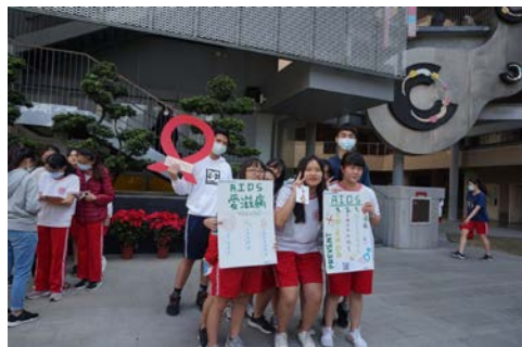
3-7 社團性教育宣導活動