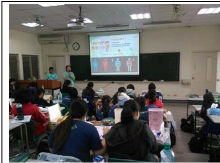
3-1 愛滋病防治入班宣導