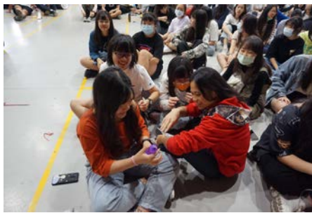
3-4 保險套技術-分組練習