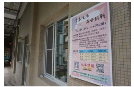
3-6 青少年性教育海報