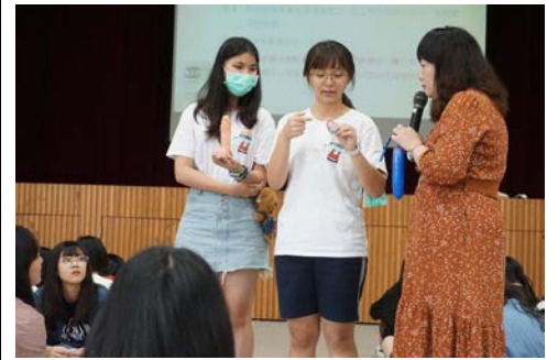
3-3 指導保險套使用技巧