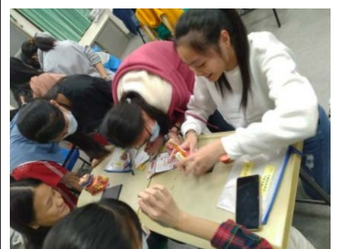
3-12 認識身體-女性生殖器模型組裝