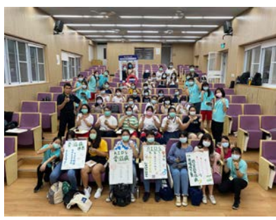
3-8 社團參與愛滋活動