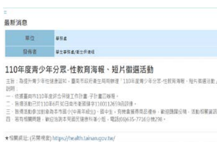
3-11 邀請學生一起參與臺南市衛生局性教育海報、短片製作等活動