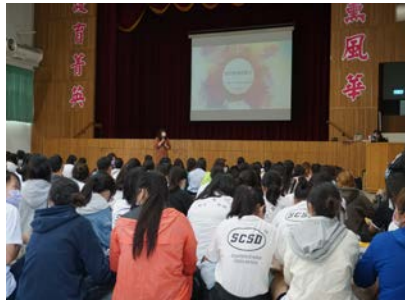
3-2「94 愛自己-我的性福我做主」