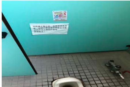
3-5 廁所內張貼正確保險套宣導